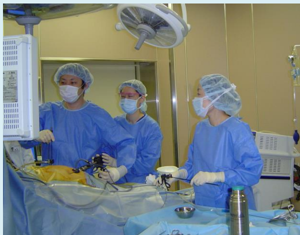
▲ 外科 腹腔鏡下手術の様子です

上記のような手術が必要な患者さんがおられましたら、当院へのご紹介をお願いします。