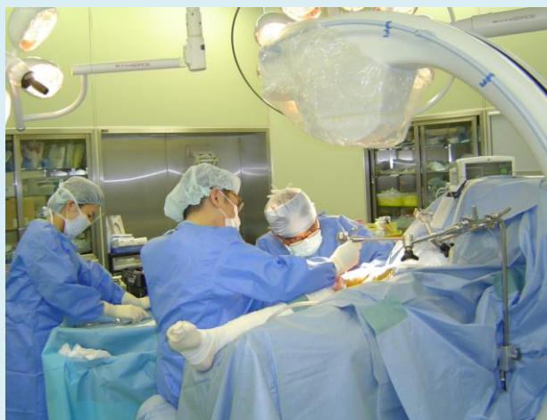
▲ こちらは整形外科の手術中