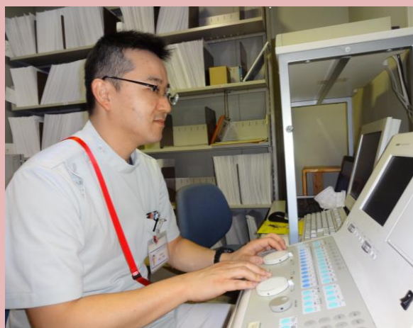
▲ オージオメーターによる聴力検査中

周囲の音が聞こえづらい、電話や会話時に相手の声が聞き取りづらい、といった症状を放っておくと日常生活に支障をきたす原因となりますので定期的な受診を心がけましょう。